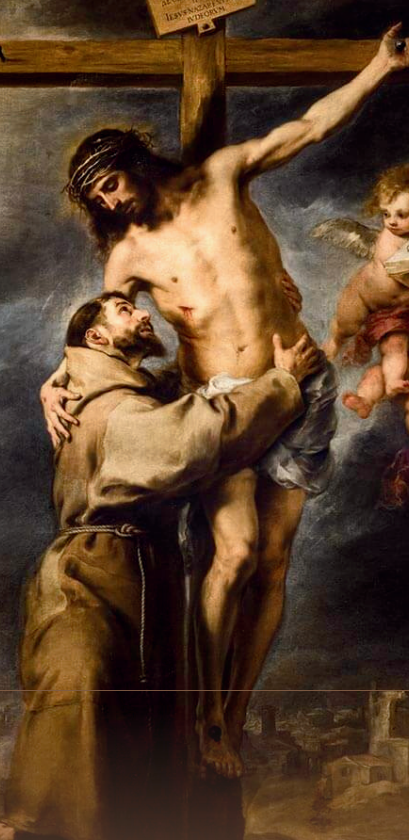
San Francisco abrazado a Cristo 1668, Óleo sobre lienzo, Bartolomé Esteban Murillo Museo de Bellas Artes de Sevilla